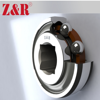
W 209PPB30 农机轴承